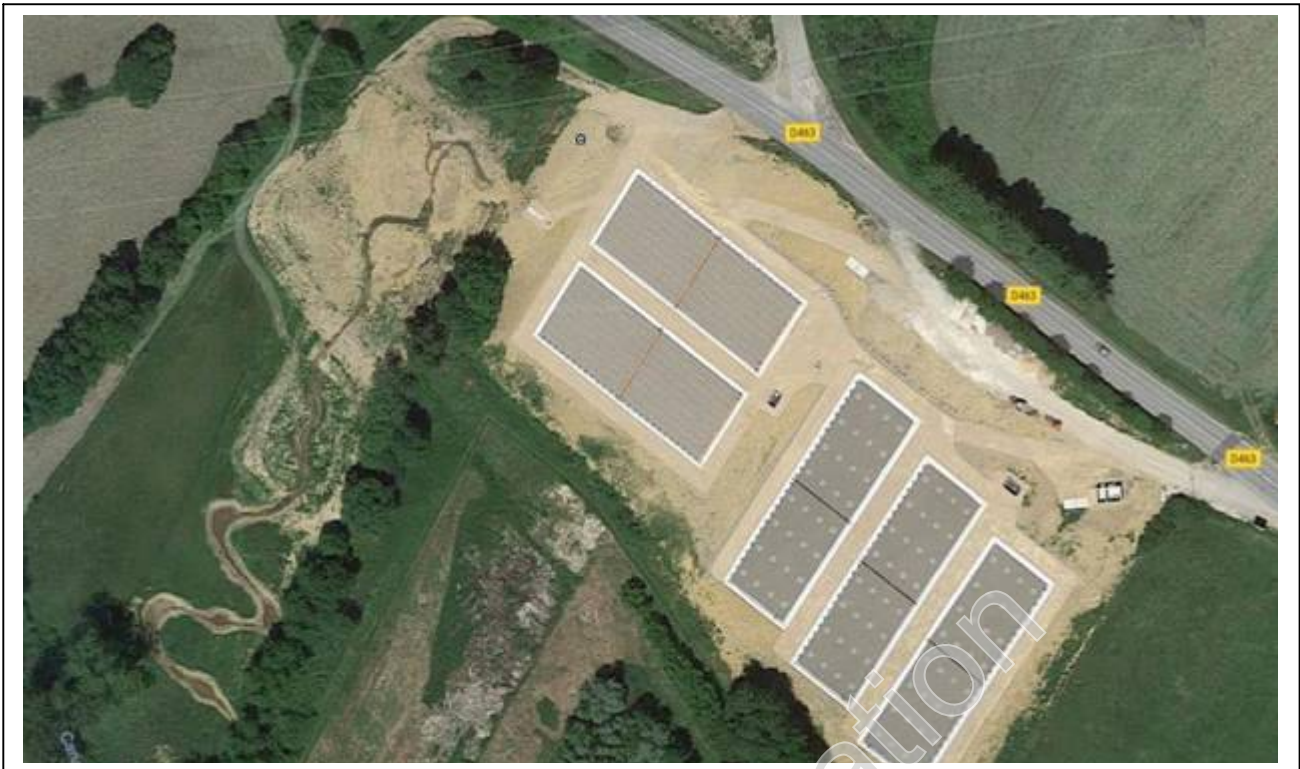
Schéma transmis par le service assainissement de la CCST sur la mise en place des réseaux et éventualité sur le lieu choisi pour implanter la future station d'assainissement sur le territoire de la commune.