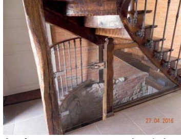
Après : transparent et sécurisé