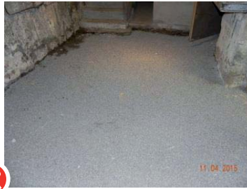
Après : assainissement réalisé