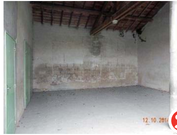
Avant : un préau d'école triste