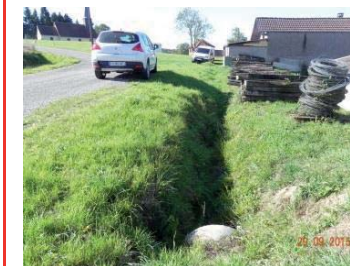
Avant : Rue de l'église