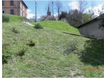
Avant : butte de l'ancien tilleul