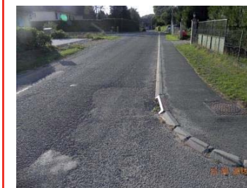
Avant : Trottoirs = voie de circulation