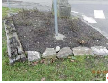
Avant : Massif calvaire