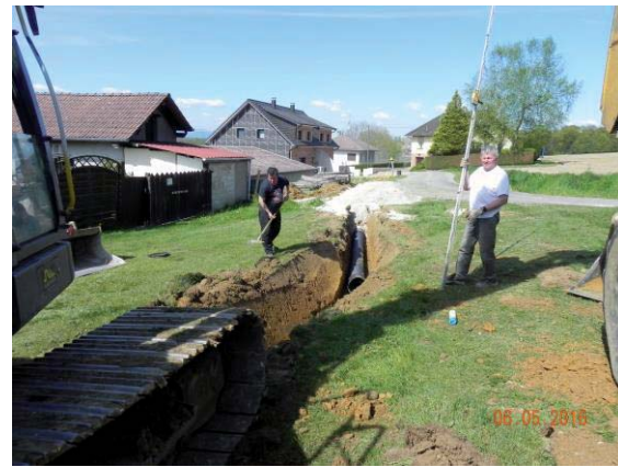
Travaux rue de l'église nécessaires à l'évacuation des eaux pluviales.

Nous attirons votre attention sur le fait que l'accès des animaux aux lieux fréquentés par les habitants et notamment par les enfants des écoles (plateau de sport, environs de la salle de restauration scolaire ou s'organisent garderie et jeux) est autorisé à condition que les propriétaires s'assurent que ces endroits restent propres.