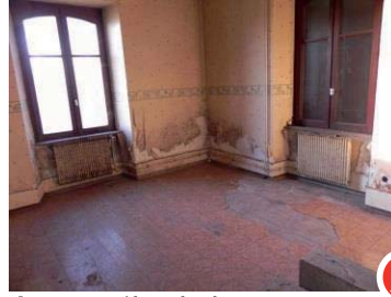
Avant : pièce à rénover