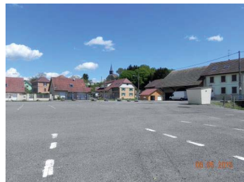
La place du village. Bientôt une rue agréable et fonctionnelle pour les habitants du lotissement

Les gros chantiers : place et rue du lotissement du moulin - place de la mairie. Ces travaux ont fait l'objet de demandes de subventions. Les investissements pour ces deux chantiers d'importance pour la commune s'élèvent à 35 000 €. Monsieur le sénateur Cédric PERRIN a annoncé une aide financière de 4 000 €. Trois autres demandes ont été adressées à la Detr, au fond particulier des « amendes de police » et dans le cadre des aides sur des fonds spéciaux. Réalisations prévues à l'automne.