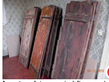
Avant : volets soumis à l'usage du temps