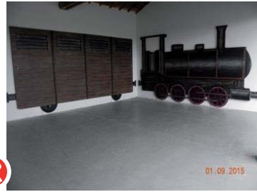
Après : hommage au poilus de 1914