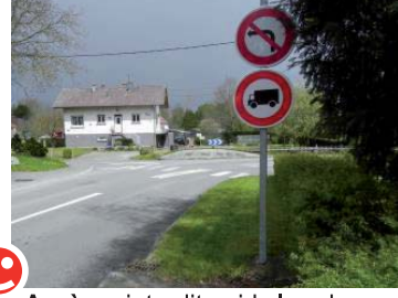
Après : interdit poids lourds