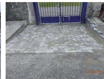
Après : Sol en pavés