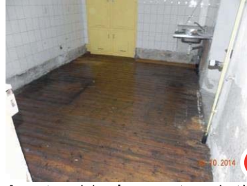
Avant : cuisine logement presbytère