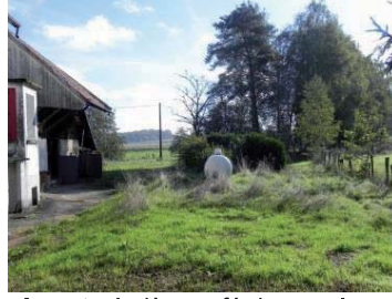
Avant : Arrière café du canal