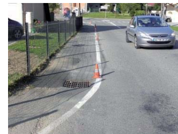
Avant : Accès entre place et école