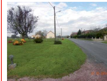
Avant : danger pour aller au canal