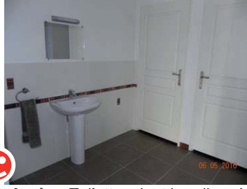
Après : Toilettes dont handicapées