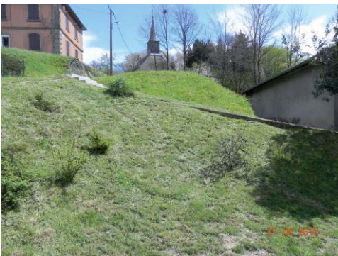
La butte de l'ancien tilleul

- Terrassement de la butte de l'ancien tilleul. Il s'agit d'effectuer un re-profilage du terrain et se servir de la terre pour aménager d'autres espaces dans le village.