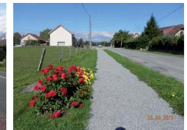
Après : un chemin piétonnier