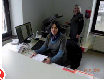
Après : un secrétariat de mairie