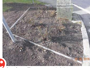
Après : Espace esthétique