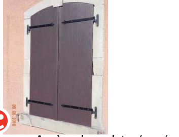
Après : les volets rénovés