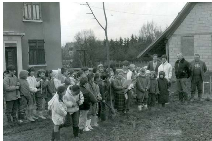
Les écoliers en 1989, ont planté symboliquement l'arbre de la liberté à l'arrière du musée de Brebotte, un tilleul qui a bien grandi, à l'image de son RPI.

La commission départementale a demandé suite à ces interventions le maintien du syndicat. Cette décision a été acceptée par Monsieur le préfet. Un bel exemple qui prouve simplement qu'il faut, dans ce monde, savoir se défendre.