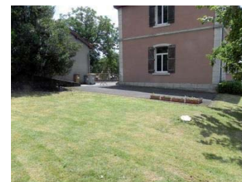
Avant : Parking logement devant école