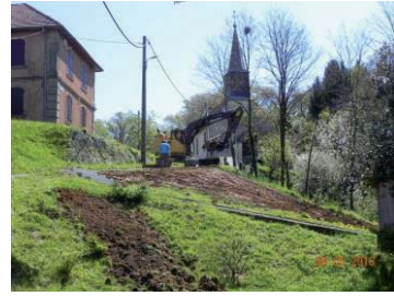
Après : Terrassement et visibilité