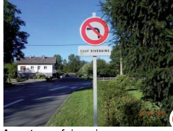
Avant : sauf riverains