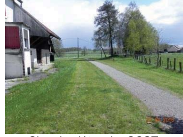
Chemin piétonnier CCST