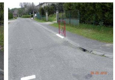
Après : Trottoir piétons sécurisé