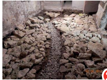
Avant : sous sol mairie humide