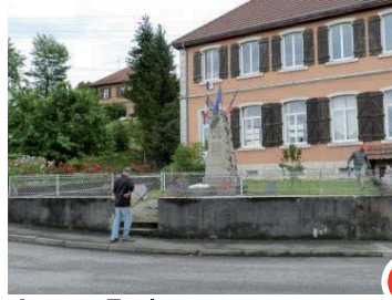
Avant : Ecole et monument