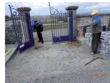
Avant : Entrée cimetière en graviers