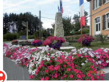
Après : Hommage fleuri