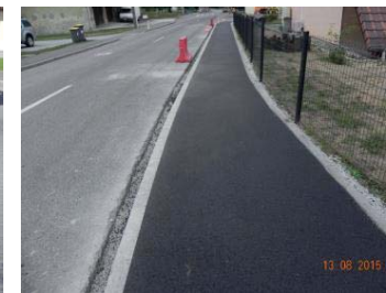
Après : Trottoir sécurisé enfants