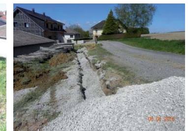
Après : fossés rebouchés