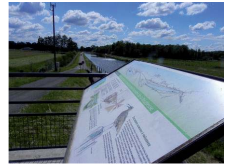
La table d'orientation au pont du canal

Après les maisons sur l'eau et dans les arbres de l'étang VERCHAT de Joncherey, le projet de Brebotte représente le second axe de développement touristique du Sud Territoire de Belfort. Une chance pour Brebotte et pour l'emploi.