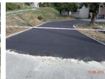
Après : indépendant à l'arrière