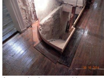
Avant : Accès cave mairie