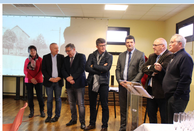
Les élus départementaux et régionaux lors de la réunion qui a suivi la pose de la première poutre par le président de la CCST

Le compte rendu complet de cette réunion du 19 décembre 2017 est consultable au panneau d'affichage de la mairie