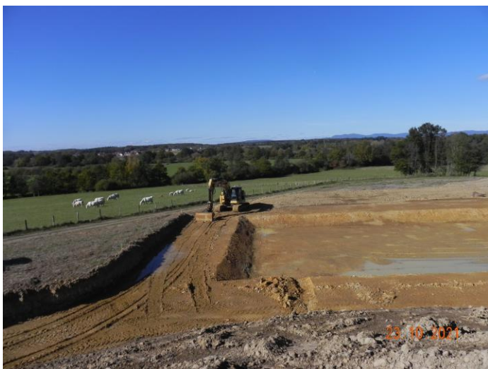
La station d'épuration ressemblera à celle de Florimont

Les travaux ont débuté sous l'impulsion de la communauté de commune qui a cette compétence. L'unité de traitement prévue initialement sur la commune de Brebotte est réalisée sur la commune de Froidefontaine. Les arguments convainquants des élus de Brebotte ont été entendus et pris en compte dans les études. Il faut maintenant que le dossier de réalisation du réseau et des stations de pompage sur la commune de Brebotte nous soit communiqué. Les élus ont demandé à être informés à ce sujet. Ils souhaitent dans un deuxième temps une réunion publique d'information.