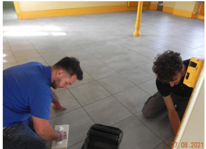
L'entreprise DE STEFANO de Belfort en action.

Rénovation complète du sol (carrelage), du hall, de la salle de classe, de l'ancien secrétariat de mairie.