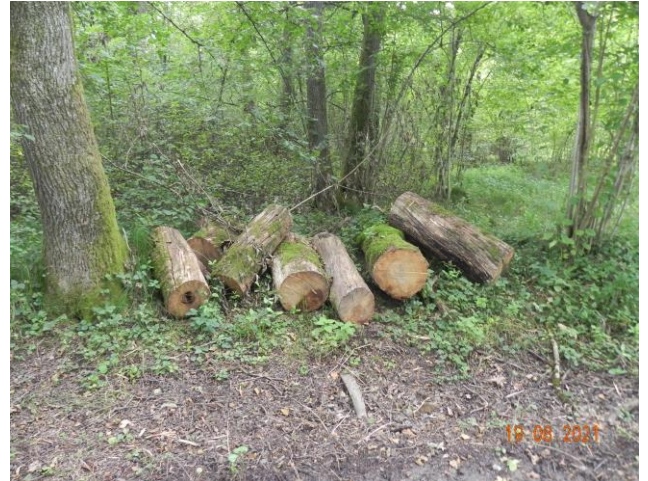
Proposer un plan de reboisement et veiller au maintien du nombre d'arbres dans les forêts communales

La plantation de nouvelles essences de bois plus résistantes est à étudier pour la commune.