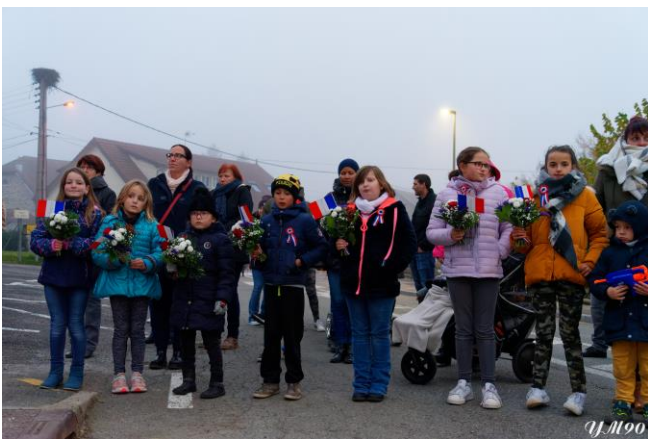
Les 7 soldats de 1914/1918 et les 7 enfants d'aujourd'hui