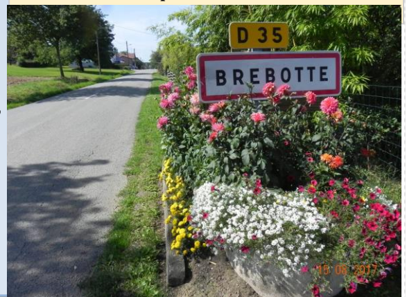
Arrivée au village depuis la route de Bretagne

Notre commune est dynamique et attrayante, le fleurissement y contribue. C'est un gros travail de bénévoles ayant un savoir-faire, une passion, du courage et un désintéressement total. La seule chose qui leur importe c'est que le village soit beau et attrayant. Le conseil municipal les en remercie.